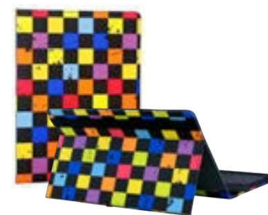
Squares 7"-8" EVUN000806 Squares 9,7" – 10,1" EVUN000807