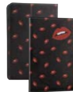
Lips 7" EVUS2PP011 Lips 9,7"-10,1" EVUS2PP012