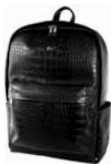
Black 15,4"-16" EVBP003000