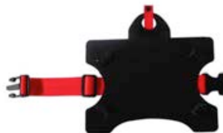
Universal Headrest Mount 9-10" Black EVACC00020