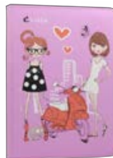
Fashion Girls EVEBP00401