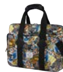
Butterflies 15,4"-16" EVLB000467