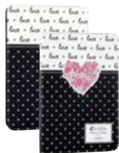
Love 7" EVUS2PP031 Love 9,7"-10,1" EVUS2PP032