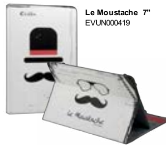
Le Moustache 7" EVUN000419