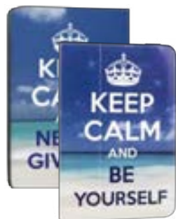
Keep Calm 7" EVUS2PP002