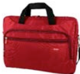
Red 15,4"-16" EVLB000051