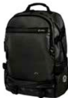
Black 15,4"-16" EVBP004050