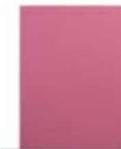
Pink 7"-8" EVUN000702 Pink 9,7" - 10,1" EVUN000705