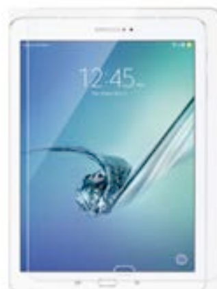
Samsung GT 4 7" EVTG000002