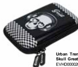
Urban Trendy Skull Great Life EVHD000020