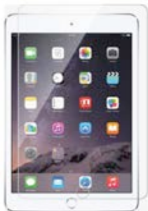
iPad Air / iPad air 2 EVTG000003