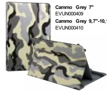
Cammo Grey 7" EVUN000409 Cammo Grey 9,7"-10,1" EVUN000410