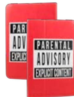
Parental Advisory 7" EVUS2PP005