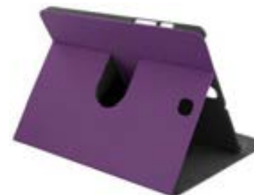
Purple 8" EVSG000701 Purple 9,7" EVSG000703