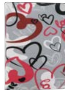
Crazy Hearts EVEBP00404