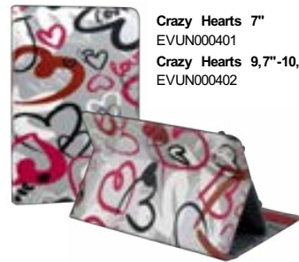
Crazy Hearts 7" EVUN000401 Crazy Hearts 9,7"-10,1" EVUN000402