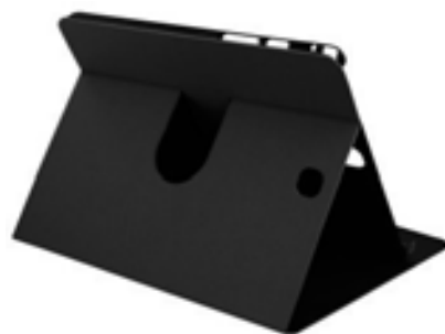
Black 10,1" EVSG000606