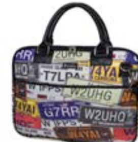
Vintage Plates 15,4"-16" EVLB000187