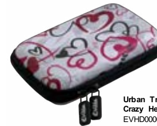
Urban Trendy Crazy Hearts EVHD000013