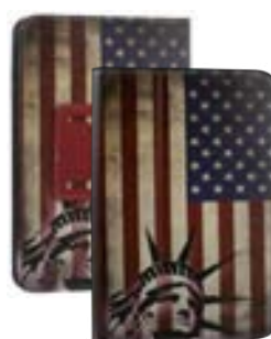
USA 7" EVUN000291 USA 9,7"-10,1" EVUN000296