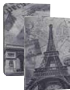
Paris 7" EVUS2PP023 Paris 9,7"-10,1" EVUS2PP024