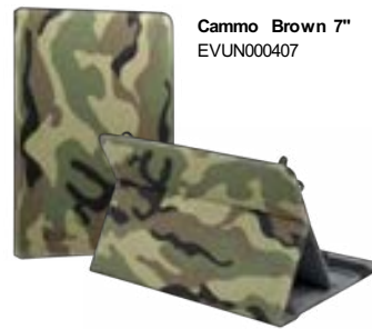
Cammo Brown 7" EVUN000407