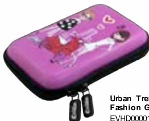
Urban Trendy Fashion Girls EVHD000014