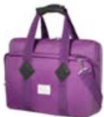
Purple 15,4"-16" EVLB000462