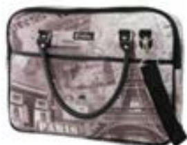
Paris 15,4"-16" EVLB000181