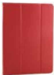
Red 7-8" EVCF000002 Red 9-10,1" EVCF000007