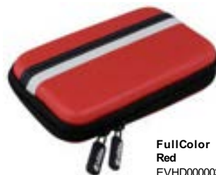
FullColor Red EVHD000003