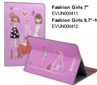
Fashion Girls 7" EVUN000411 Fashion Girls 9,7"-10,1" EVUN000412