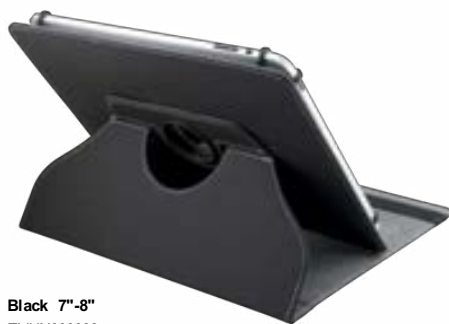
Black 7"-8" EVUN000033 Black 9,7"-10,1" EVUN000036