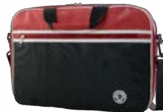
Red 11"-12,5" EVLB000122