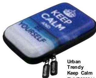
Urban Trendy Keep Calm EVHD000011