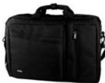
Black 15,4"-16" EVLB000450