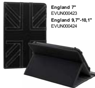
England 7" EVUN000423 England 9,7"-10,1" EVUN000424