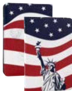
Liberty 7" EVUS2PP039 Liberty 9,7"-10,1" EVUS2PP040