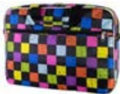
Squares 15,4"-16" EVLB000201