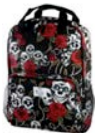
Skulls 15,4"-16" EVBP001000