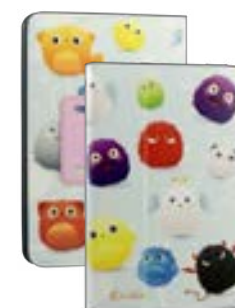
Fruity 7" EVUN000293 Fruity 9,7"-10,1" EVUN000298