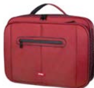
Red 15,4"-16" EVLB000501