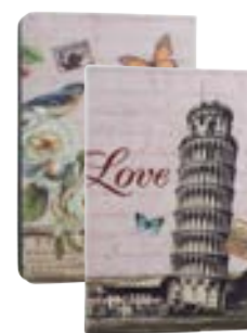
Pisa 7" EVUS2PP025 Pisa 9,7"-10,1" EVUS2PP026