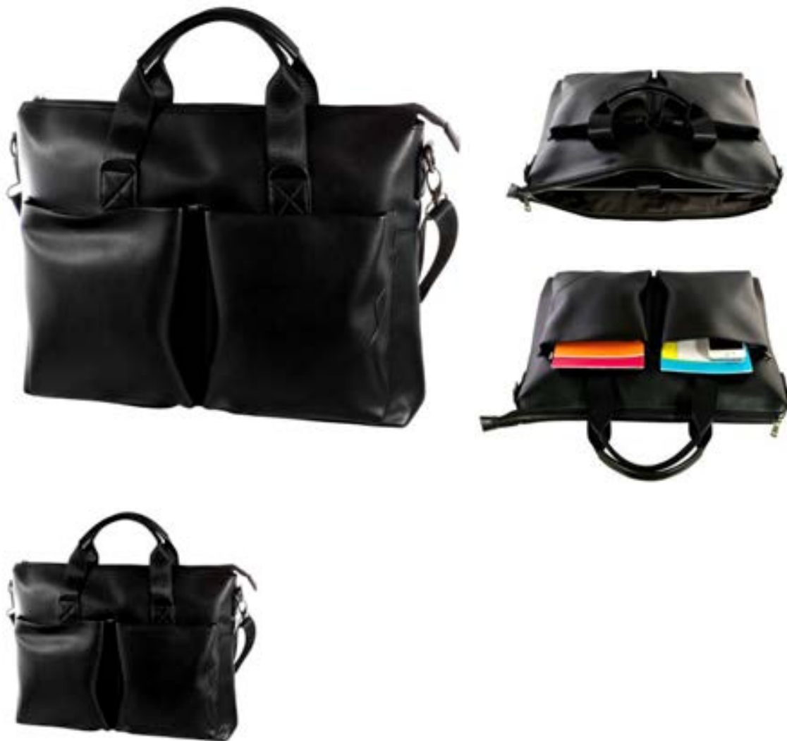
Black 15,4"-16" EVLB000400