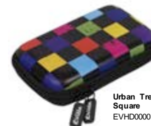
Urban Trendy Square EVHD000018