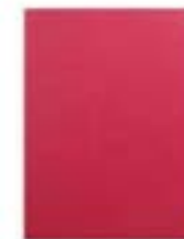
Red 7"-8" EVUN000701 Red 9,7" - 10,1" EVUN000704