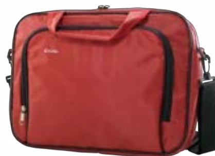
Red 15,4"-16" EVLB000151