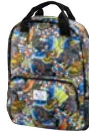
Butterflies 15,4"-16" EVBP001007