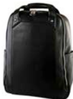
Smart 15,4"-16" EVBP003500