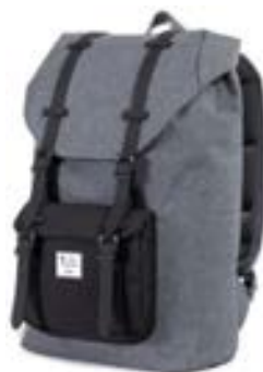
Grey 15,4"-16" EVBP002001