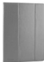
Silver 7-8" EVCF000004 Silver 9-10,1" EVCF000009