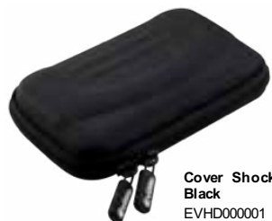
Cover Shock Black EVHD000001