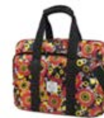
Zanzibar 15,4"-16" EVLB000468