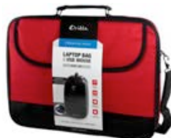
Red 15,4"-16" EVLB000301