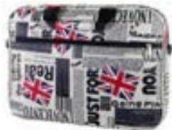
England 15,4"-16" EVLB000203