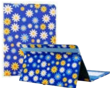
Daisies 7"-8" EVUN000800 Daisies 9,7" – 10,1" EVUN000801