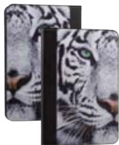
White Tiger 7" EVUS2PP017 White Tiger 9,7"-10,1" EVUS2PP018