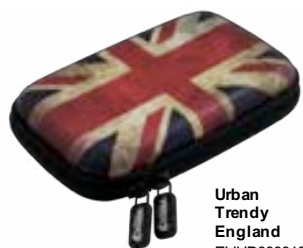
Urban Trendy England EVHD000010