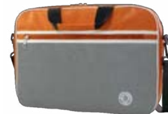
Orange 11"-12,5" EVLB000123