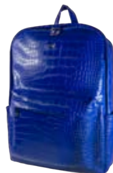
Dark Blue 15,4"-16" EVBP003002