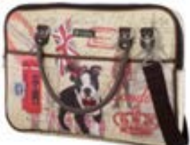
London Dog 15,4"-16" EVLB000183