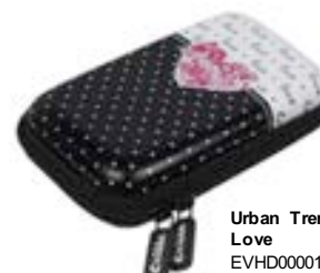
Urban Trendy Love EVHD000017