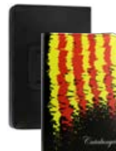
Catalunya 7" EVUN000275 Catalunya 9,7"-10,1" EVUN000299