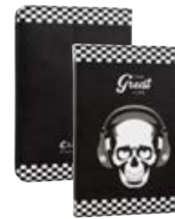
Skull Great Life 7" EVUS2PP037 Skull Great Life 9,7"-10,1" EVUS2PP038