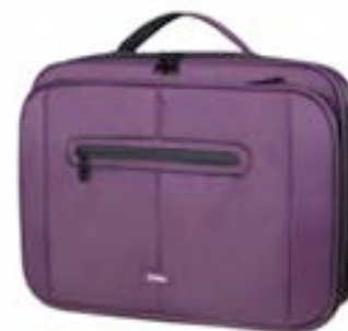
Purple 15,4"-16" EVLB000502