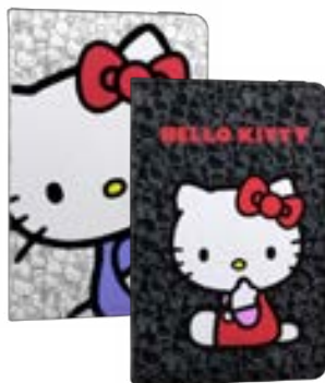
White 6" EVEBP00403