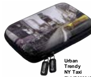
Urban Trendy NY Taxi EVHD000012