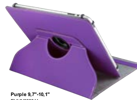
Purple 9,7"-10,1" EVUN000041