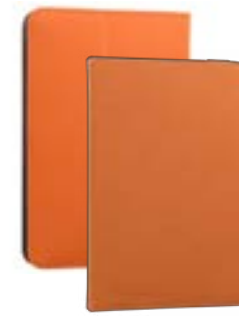
Orange 7" EVUN000361 Orange 9,7"-10,1" EVUN000363