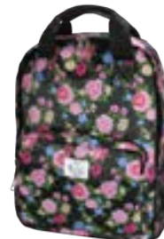
Roses 15,4"-16" EVBP001006