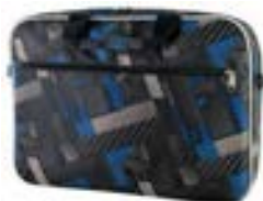
Surf 15,4"-16" EVLB000204