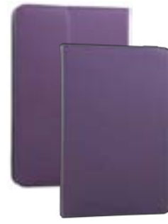
Purple 7" EVUN000360 Purple 9,7"-10,1" EVUN000362