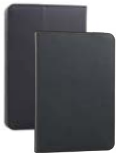
Black 7" EVUN000280 Black 9,7"-10,1" EVUN000283