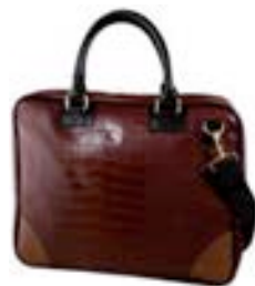
Brown 15,4"-16" EVLB000262