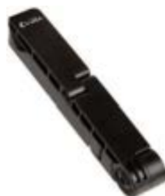
Tablet Stand 7-10,1" Black EVACC00001