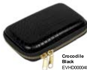
Crocodile Black EVHD000040