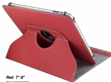
Red 7"-8" EVUN000035 Red 9,7"-10,1" EVUN000038