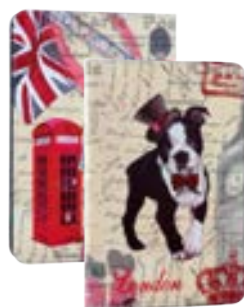
London dog 7" EVUS2PP021 London dog 9,7"-10,1" EVUS2PP022