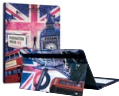
England 7"-8" EVUN000802 England 9,7" – 10,1" EVUN000803