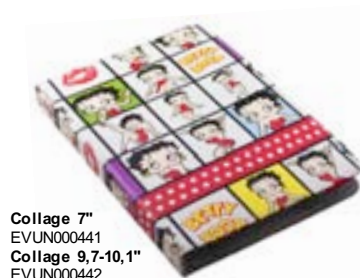
Collage 7" EVUN000441 Collage 9,7-10,1" EVUN000442