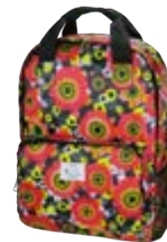
Zanzibar 15,4"-16" EVBP001008