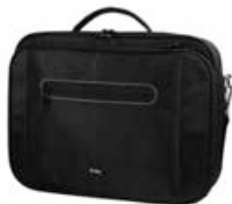
Black 15,4"-16" EVLB000500