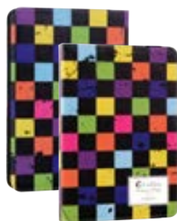
Square 7" EVUS2PP033 Square 9,7"-10,1" EVUS2PP034