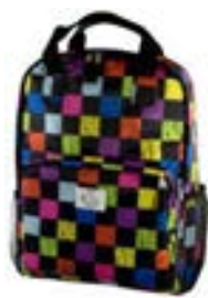
Squares 15,4"-16" EVBP001002