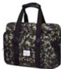
Camouflage 15,4"-16" EVLB000465