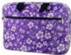
Flowers 15,4"-16" EVLB000202