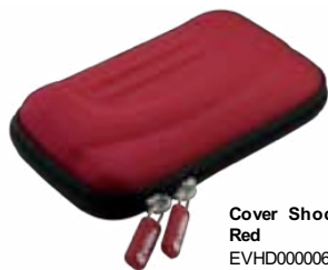
Cover Shock Red EVHD000006