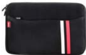
Black 13,3"-14" EVLS000001 Black 15,4"-16" EVLS000005