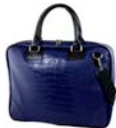
Dark Blue 15,4"-16" EVLB000263