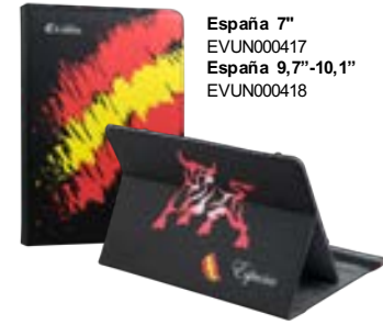
España 7" EVUN000417 España 9,7"-10,1" EVUN000418