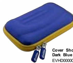
Cover Shock Dark Blue EVHD000007