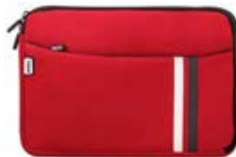
Red 13,3"-14" EVLS000002 Red 15,4"-16" EVLS000006