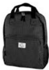
Dots 15,4"-16" EVBP001001