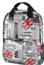
England 15,4"-16" EVBP001005