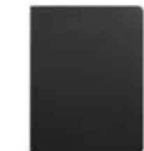
Black 7"-8" EVUN000700 Black 9,7" - 10,1" EVUN000703