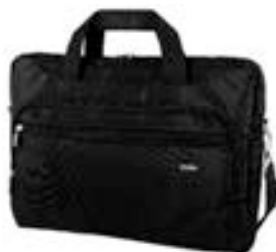
Black 15,4"-16" EVLB000060