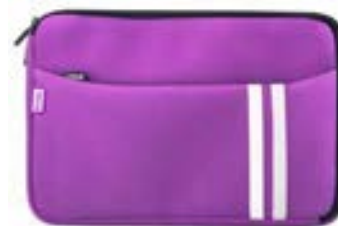
Purple 13,3"-14" EVLS000003 Purple 15,4"-16" EVLS000007