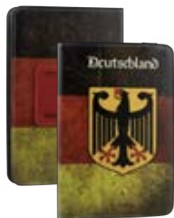
Germany 7" EVUN000289 Germany 9,7"-10,1" EVUN000294