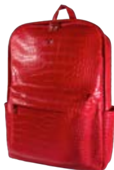
Dark Red 15,4"-16" EVBP003001