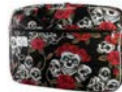
Skull 15,4"-16" EVLB000207