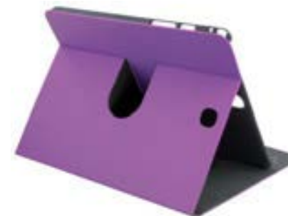
Purple 10,1" EVSG000608