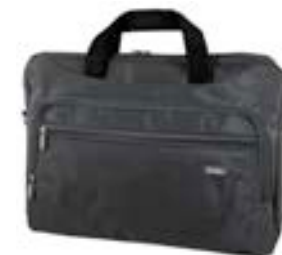
Purple 15,4"-16" EVLB000052