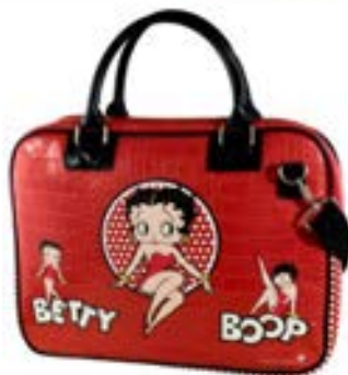
TRENDY LAPTOP BAG Betty Boop 15,4"-16" EVLB000185