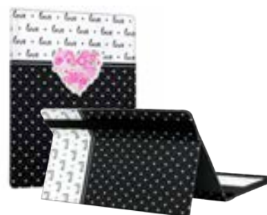
Love 7"-8" EVUN000804 Love 9,7" – 10,1" EVUN000805