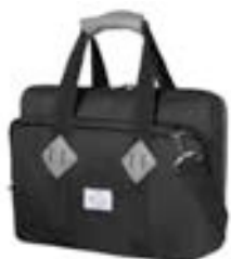
Black 15,4"-16" EVLB000460