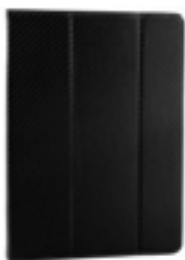
Black 7-8" EVCF000001 Black 9-10,1" EVCF000006

Sistema de fijación mediante moldes de plástico que se adaptan a las esquinas de tu tablet permitiendo utilizar cualquier tipo o marca de dispositivo. Disponible para tablets de 7" a 8", y de 9" a 10,1"