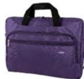
Purple 15,4"-16" EVLB000052