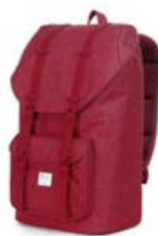
Dark Red 15,4"-16" EVBP002002