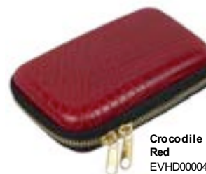
Crocodile Red EVHD000041