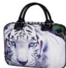
White Tiger 15,4"-16" EVLB000186