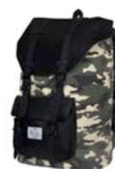
Camo 15,4"-16" EVBP002004