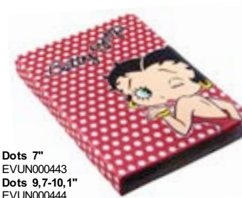
Dots 7" EVUN000443 Dots 9,7-10,1" EVUN000444