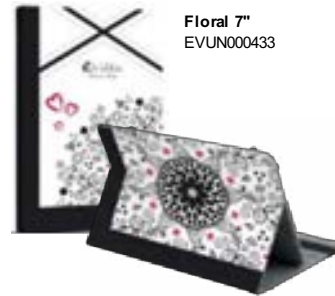
Floral 7" EVUN000433