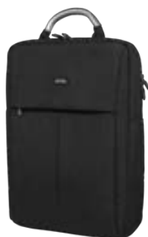
Black 15,4"-16" EVBP004000