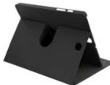
Black 8" EVSG000700 Black 9,7" EVSG000702