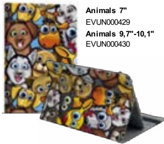
Animals 7" EVUN000429 Animals 9,7"-10,1" EVUN000430