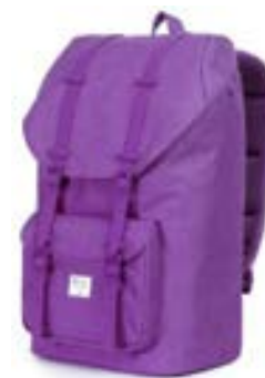
Purple 15,4"-16" EVBP002003