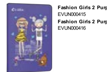
Fashion Girls 2 Purple 7" EVUN000415 Fashion Girls 2 Purple 9,7"-10,1" EVUN000416