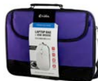
Purple 15,4"-16" EVLB000302