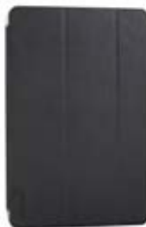
Black 7" EVSG000650 Black 10,1" EVSG000680

Cierre de seguridad mediante un novedoso sistema de microventosas que se adhieren a la pantalla de tu dispositivo