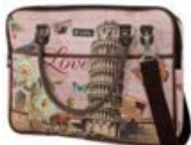
Pisa 15,4"-16" EVLB000182