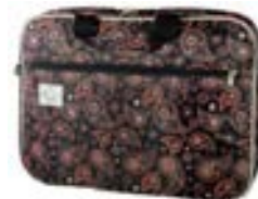
Drop 15,4"-16" EVLB000206