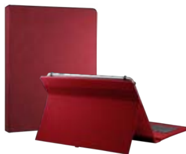
Red 7"-8" EVUN000507 Red 9,7" – 10,1" EVUN000509