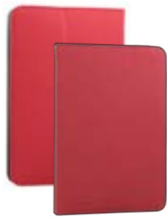
Red 7" EVUN000281 Red 9,7"-10,1" EVUN000284