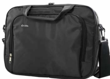
Black 11"-12,5" EVLB000160 Black 15,4"-16" EVLB000150