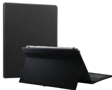
Black 7"-8" EVUN000506 Black 9,7" – 10,1" EVUN000508