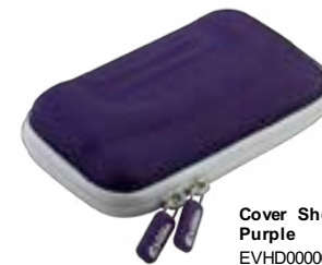
Cover Shock Purple EVHD000008