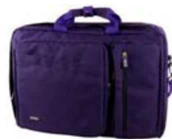
Purple 15,4"-16" EVLB000452