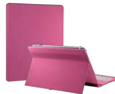
Pink 7"-8" EVUN000510 Pink 9,7" – 10,1" EVUN000511