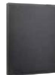
Black 7"-8" EVUN000502 Black 9,7" – 10,1" EVUN000504