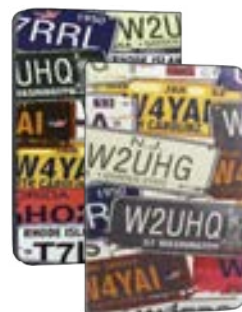
Vintage Plates 7" EVUS2PP004 Vintage Plates 9,7"-10,1" EVUS2PP009