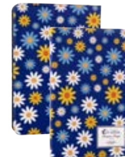
Daisies 7" EVUS2PP027 Daisies 9,7"-10,1" EVUS2PP028