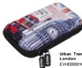
Urban Trendy London EVHD000016