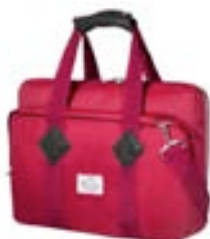
Red 15,4"-16" EVLB000461