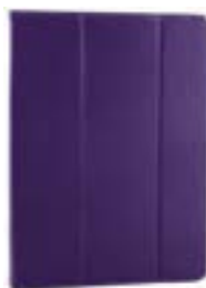
Purple 7-8" EVCF000003 Purple 9-10,1" EVCF000008