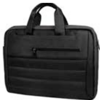
Black 15,4"-16" EVLB000550