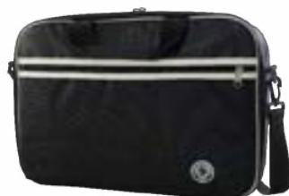
Black 11"-12,5" EVLB000120