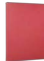
Red 7"-8" EVUN000503 Red 9,7" – 10,1" EVUN000505