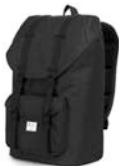
Black 15,4"-16" EVBP002000