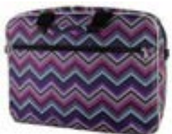
Angles 15,4"-16" EVLB000200