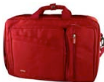
Red 15,4"-16" EVLB000451