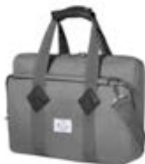
Grey 15,4"-16" EVLB000464