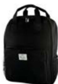
Black 15,4"-16" EVBP001004