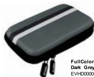
FullColor Dark Grey EVHD000050