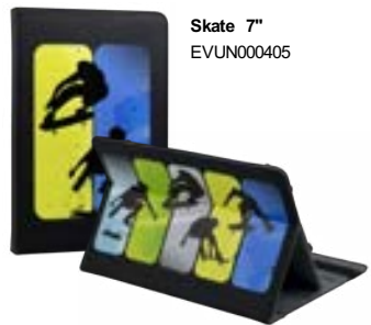
Skate 7" EVUN000405