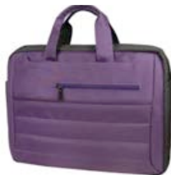
Purple 15,4"-16" EVLB000551