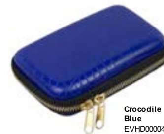
Crocodile Blue EVHD000042