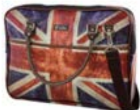
England 15,4"-16" EVLB000180