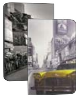
NY Taxi 7" EVUS2PP003 NY Taxi 9,7"-10,1" EVUS2PP008