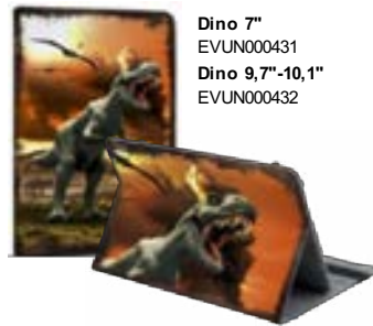
Dino 7" EVUN000431 Dino 9,7"-10,1" EVUN000432