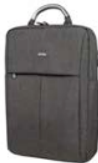
Grey 15,4"-16" EVBP004001