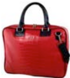
Red 15,4"-16" EVLB000261