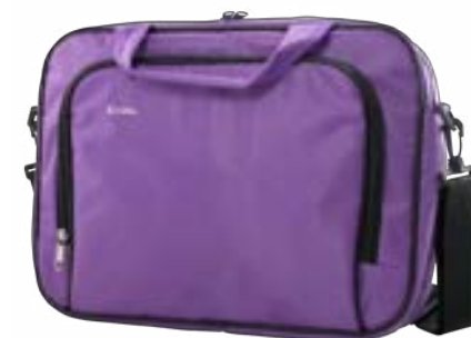
Purple 15,4"-16" EVLB000152