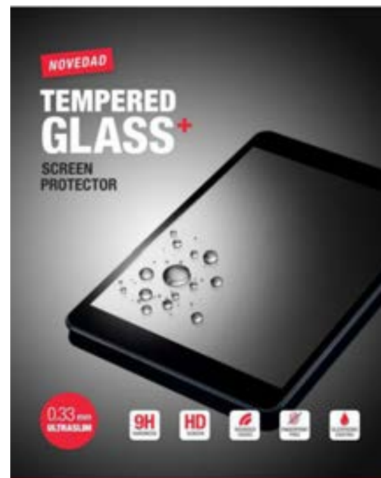
Samsung GT A 7" EVTG000011 Samsung GT A 10,1" EVTG000012