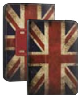
England 7" EVUN000290 England 9,7"-10,1" EVUN000295