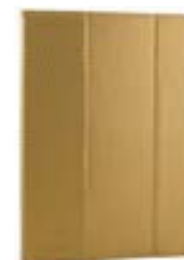
Gold 7-8" EVCF000005 Gold 9-10,1" EVCF000010