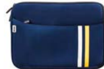
Blue 13,3"-14" EVLS000004 Blue 15,4"-16" EVLS000008