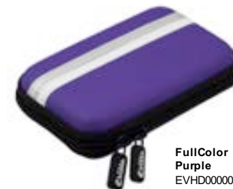
FullColor Purple EVHD000009