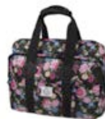
Roses 15,4"-16" EVLB000466