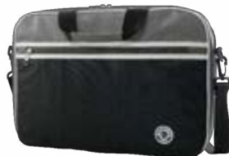
Grey 11"-12,5" EVLB000121