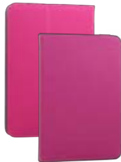
Pink 7" EVUN000282 Pink 9,7"-10,1" EVUN000285