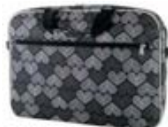
Heart 15,4"-16" EVLB000205