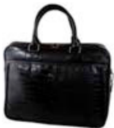
Black 15,4"-16" EVLB000260