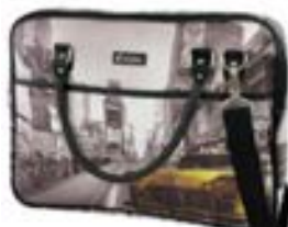
NY Taxi 15,4"-16" EVLB000184