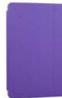
Purple 7" EVSG000652 Purple 10,1" EVSG000682