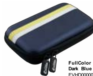
FullColor Dark Blue EVHD000005