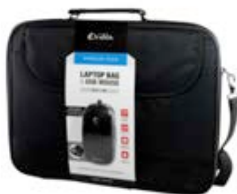
Black 15,4"-16" EVLB000300