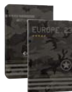
Camouflage 7" EVUS2PP035 Camouflage 9,7"-10,1" EVUS2PP036