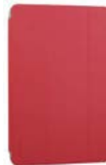
Red 7" EVSG000651 Red 10,1" EVSG000681