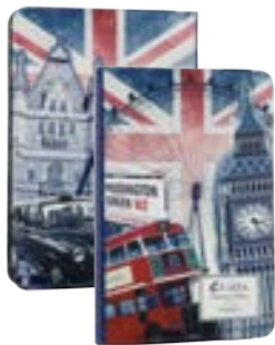
London 7" EVUS2PP029 London 9,7"-10,1" EVUS2PP030