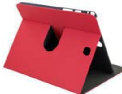
Red 10,1" EVSG000607