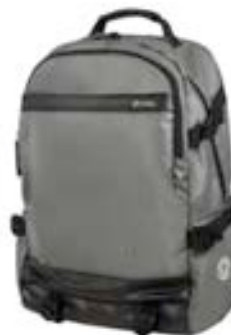
Grey 15,4"-16" EVBP004051