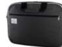
Dots 15,4"-16" EVLB000208