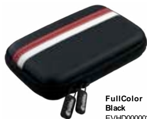
FullColor Black EVHD000002