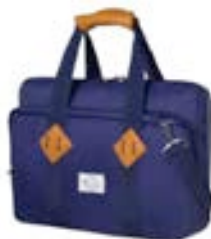
Dark Blue 15,4"-16" EVLB000463